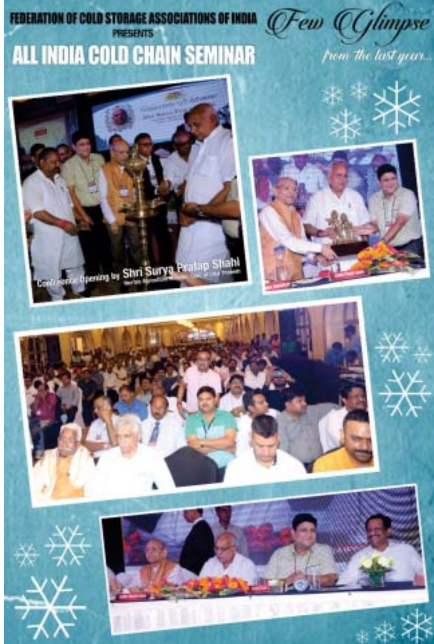
(5) – पत्रिका कोल्ड स्टोरेज एसोसिएशन उत्तर प्रदेश, जून, 2018