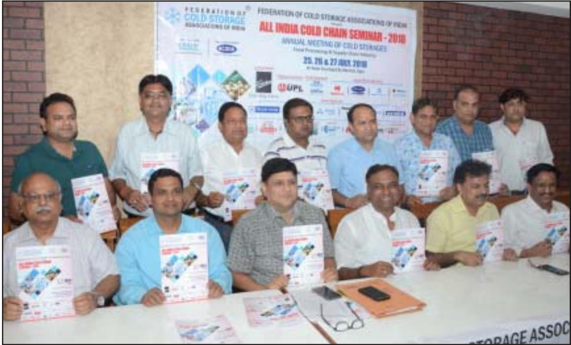
(6) – पत्रिका कोल्ड स्टोरेज एसोसिएशन उत्तर प्रदेश, जून, 2018

इस प्रेस Conference में होने वाली सेमिनार के लिए जारी किया गया Brochure का विमोचन भी किया गया। विमोचन करते हुए फेडरेशन के सदस्य यहाँ दिखाए गए हैं।