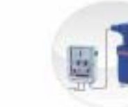
Electronic Liquid Level Controller