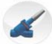
Stop Cum Check Valves