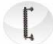
Reflex Glass Liquid Level Indicator