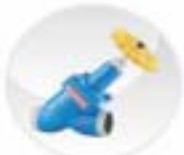
Weld-in Line Stop Valves