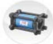
In-line Check Valves