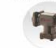
C.I. Strainer Valves