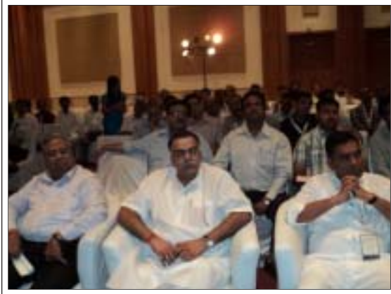
फेडरेशन ऑफ कोल्ड स्टोरेज एसोसिएशन्स ऑफ इण्डिया की वार्षिक मीटिंग का एक दृश्य।